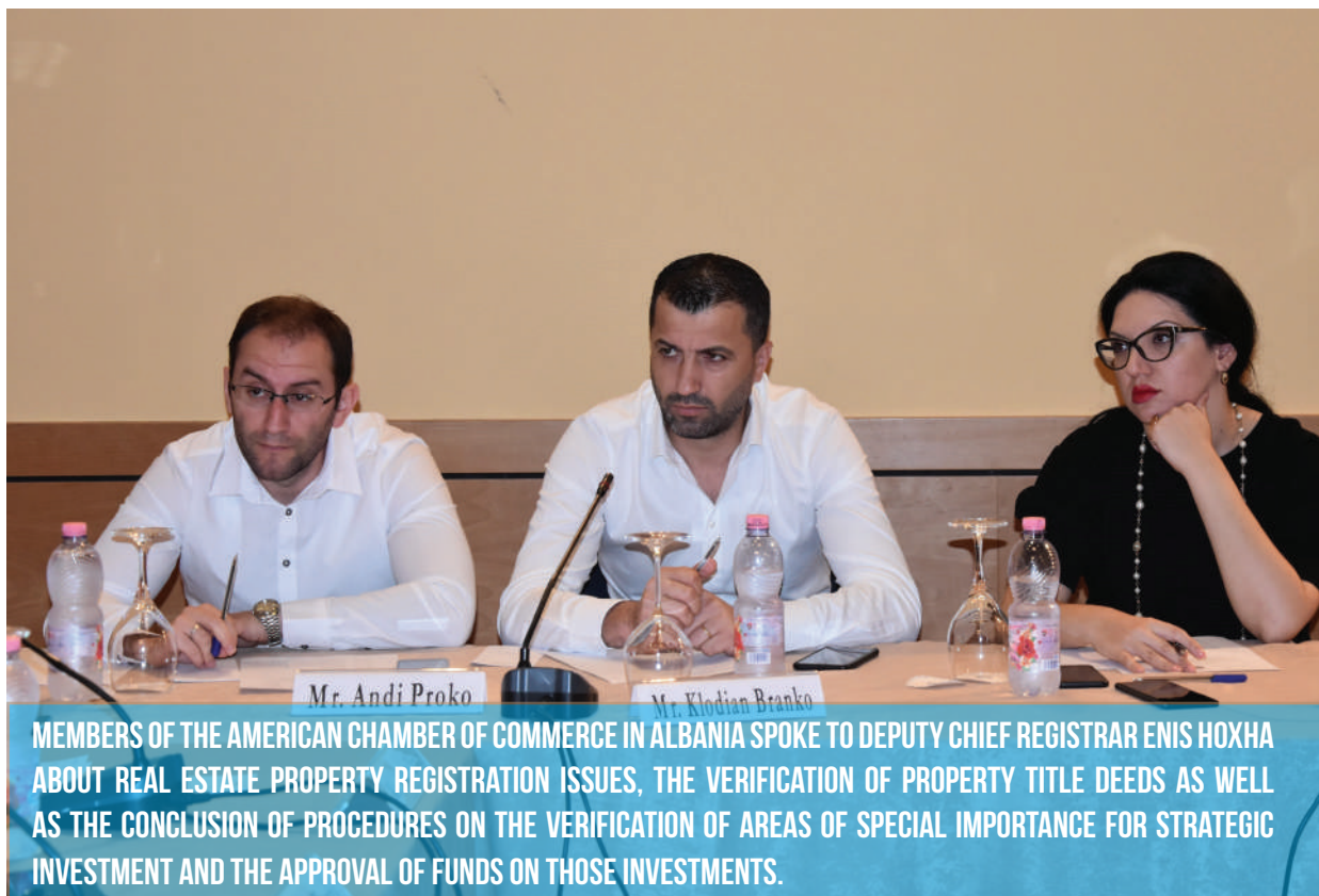
MEMBERS OF THE AMERICAN CHAMBER OF COMMERCE IN ALBANIA SPOKE TO DEPUTY CHIEF REGISTRAR ENIS HOXHA ABOUT REAL ESTATE PROPERTY REGISTRATION ISSUES, THE VERIFICATION OF PROPERTY TITLE DEEDS AS WELL AS THE CONCLUSION OF PROCEDURES ON THE VERIFICATION OF AREAS OF SPECIAL IMPORTANCE FOR STRATEGIC INVESTMENT AND THE APPROVAL OF FUNDS ON THOSE INVESTMENTS.

T he This discussion Business Forum served not only to receive information on how the property registration process is progressing throughout the country and how the coastal area properties will be registered, but also to provide Am-Cham members with an opportunity for a face-to-face discussion with the Deputy Chief Registrar of the Immovable Property Registration Office (IPRO) on issues that businesses face when dealing with Immovable property Registration District Offices (IPRDOs).